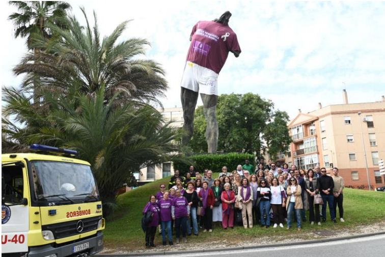
Foto de Autoridades, Consejo Local de la Mujer y otras asociaciones de mujeres.

Este acto ha contado con la colaboración del Cuerpo de Bomberos, Policía Local y Protección Civil.