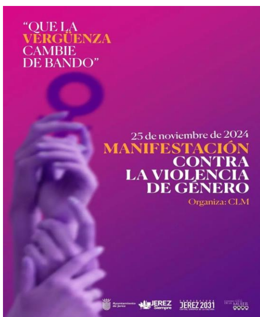
Foto Cartel de Campaña.