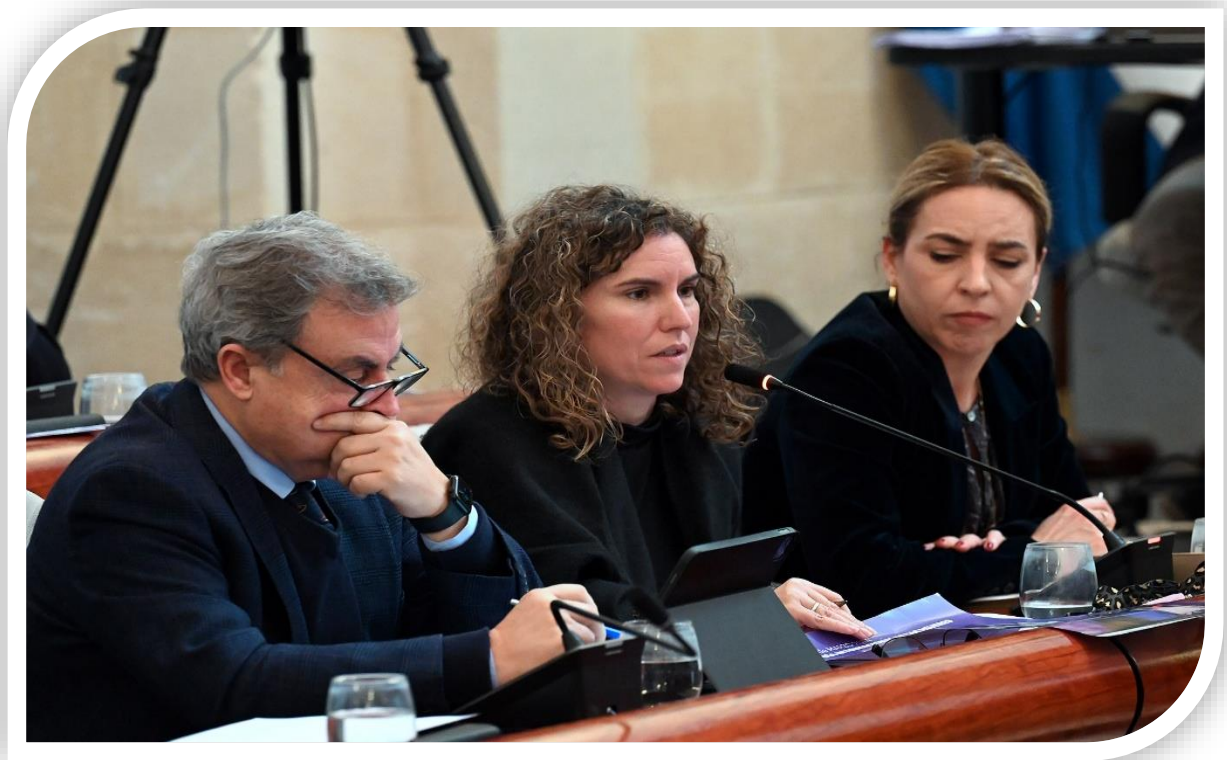
Foto Momento de la intervención de la Sra. vicepresidenta Primera del consejo Local de la Mujer, durante el Pleno de la Corporación municipal el 23 de febrero de 2024

El día 23 de febrero, la Vicepresidenta Ciudadana en representación del Consejo local de la Mujer de Jerez, asistió a un histórico Pleno de la Corporación Municipal, ya que en este Pleno fue aprobado el Manifiesto conjunto de todas las Diputaciones de Andalucía, con la proclama clara de la necesidad de que desde los distintos gobiernos de Andalucía se realicen cambios profundos en la consecución real de los derechos de las mujeres, pues se reconoce que aún queda mucho por hacer, y que no se puede desandar el camino en este sentido.