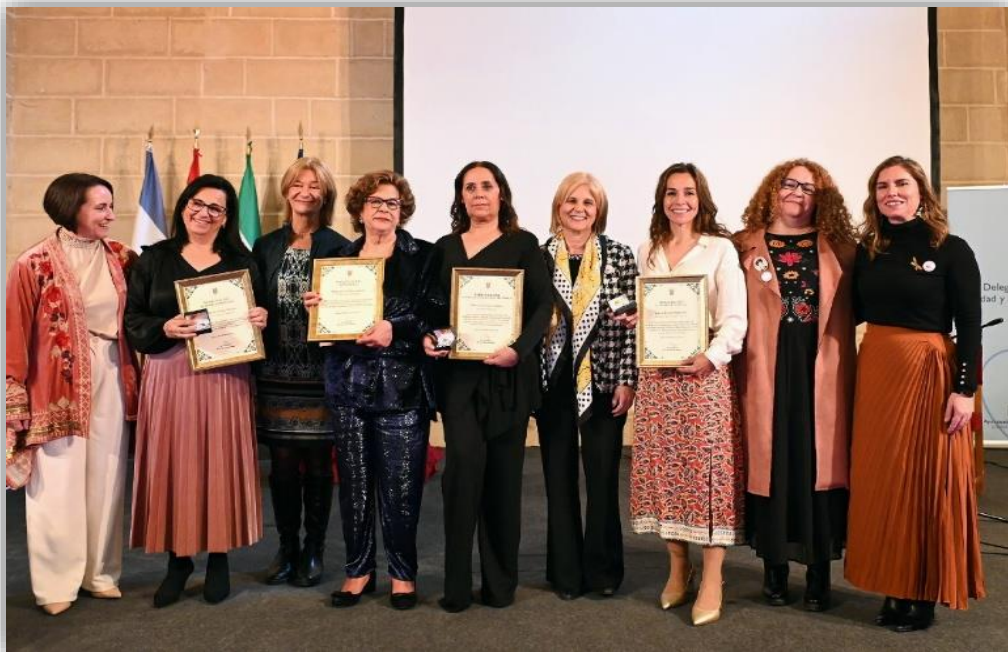
Foto: Integrantes del Equipo de Gobierno del Ayuntamiento de Jerez, junto a la Vicepresidenta Primera y Vicepresidenta Ciudadana del Consejo Local de la Mujer, y las premiadas con el Premio Racimo 2024, que en esta edición se ha diversificado por áreas, posibilitando tres premiadas, más el Premio de honor o accésit a la Paquera de Jerez.

13.30 h. Jerez de Honor por gentileza de Williams Humbert.