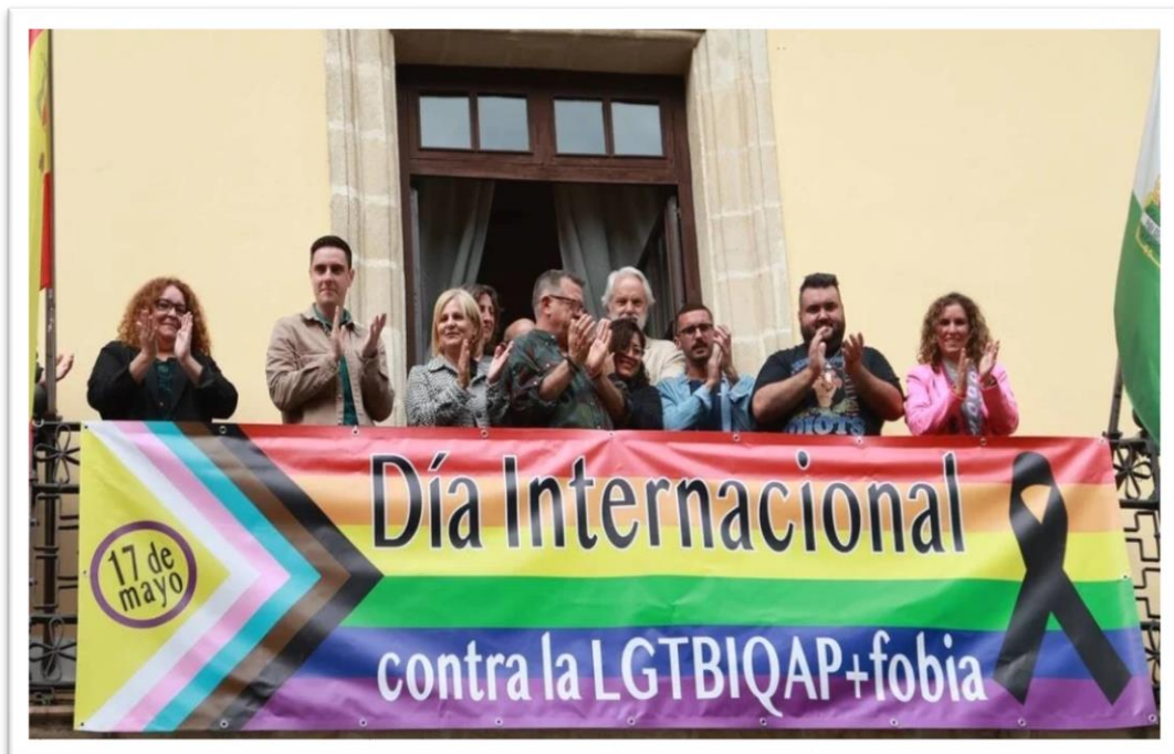
Foto: La Presidenta y Vicepresidenta Primera del Consejo Local de la Mujer, como máximas responsables de las políticas de Igualdad en el municipio, junto con la vicepresidenta Ciudadana de este Consejo y miembros de la directiva de la asociación Jerelesgay.

El CLM fue invitado a través de la Vicepresidenta Segunda, Vocal Ciudadana para la colocación de la bandera LGTBI en el balcón del Consistorio y a la entrega de los premios Arcoíris, representación que da cuenta de la necesaria implicación del Consejo en la reivindicación y conmemoración de este colectivo en nuestra ciudad.