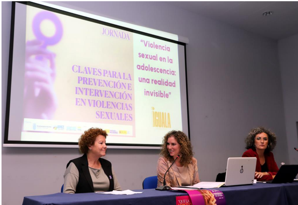
Foto de la Sra. Delegada de Igualdad, con representante de la Fed. Sol Rural y ponente.

cultural para las mujeres Marararía de Lanzarote.