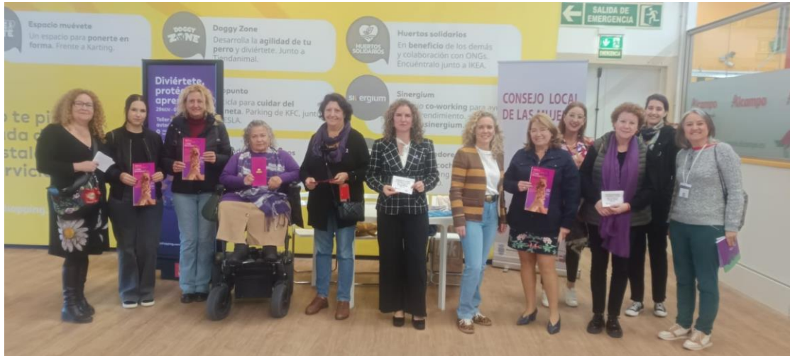
Foto: Participantes del Consejo Local de la Mujer en acto de presencia en Luz Shopping.