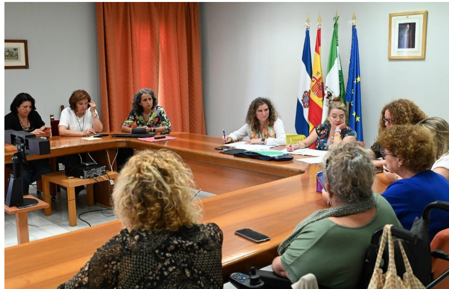
Foto: Instantánea de la Reunión del Pleno del Consejo Local de la Mujer del día 24 de mayo en la Sala U del edificio Consistorial.

Este Pleno se celebró en la Sala U del edificio Consistorial, ya que aunque la propuesta del Pleno del Consejo es mantener las reuniones en la Casa de las Mujeres, como edificio referente para actividades y participación de la red de mujeres, las actuales obras de remodelación en la Plaza del Mercado, zona confluyente con la calle Liebre, donde se sitúa la Casa de las Mujeres, dificulta el acceso de vehículos a la misma.