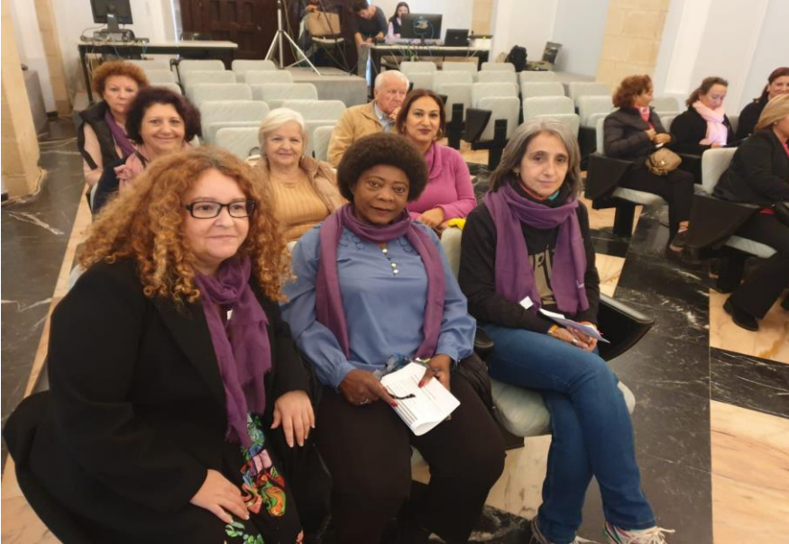
Foto: representantes del consejo Local de la Mujer durante la celebración del Pleno del 29 de noviembre.

El Consejo Local de la Mujer ha contado durante 2024 con un espacio claro en los Plenos municipales, pudiendo llevar, igual que ocurrió en la campaña del 8 de marzo.