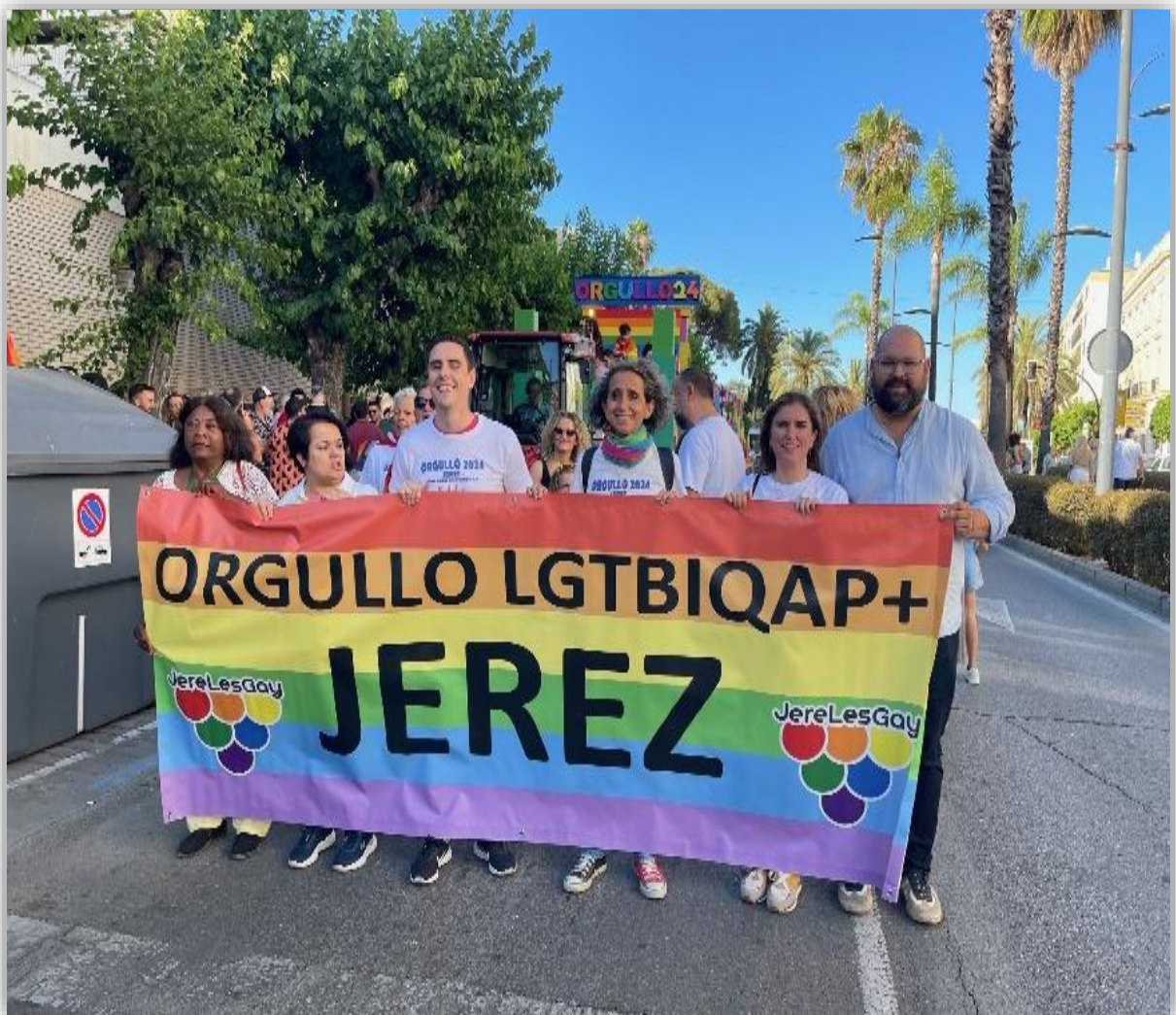
Foto: Cabecera de la manifestación por el día Institucional del Orgullo, portan la pancarta autoridades municipales y representación de las vocalías del Consejo Local de la Mujer.

En el caso de la Manifestación del día del Orgullo en Jerez, celebrada el 17 de junio, hubo una representación de vocales de la Federación de Asociaciones de mujeres de zona Urbana, del Consejo Local de la Mujer.