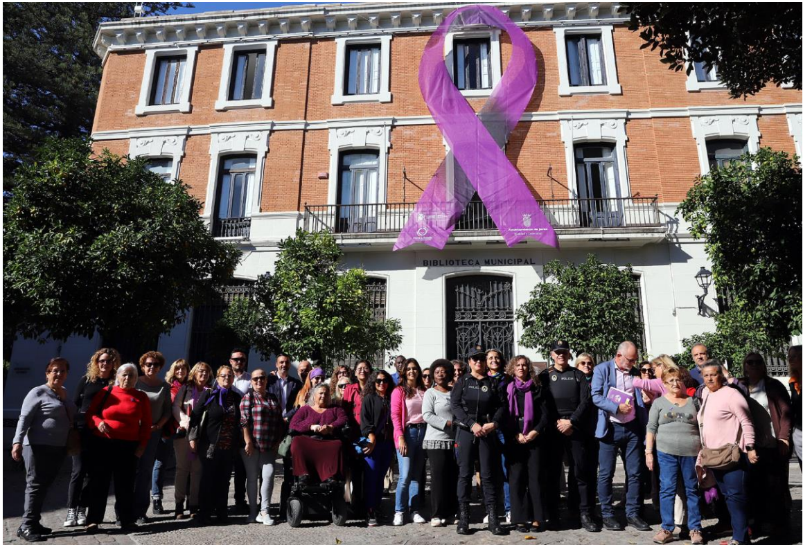
Foto de autoridades municipales, representante Delegación Provincial del Gobierno representantes del consejo local de la Mujer, y otras asociaciones de mujeres de la ciudad.