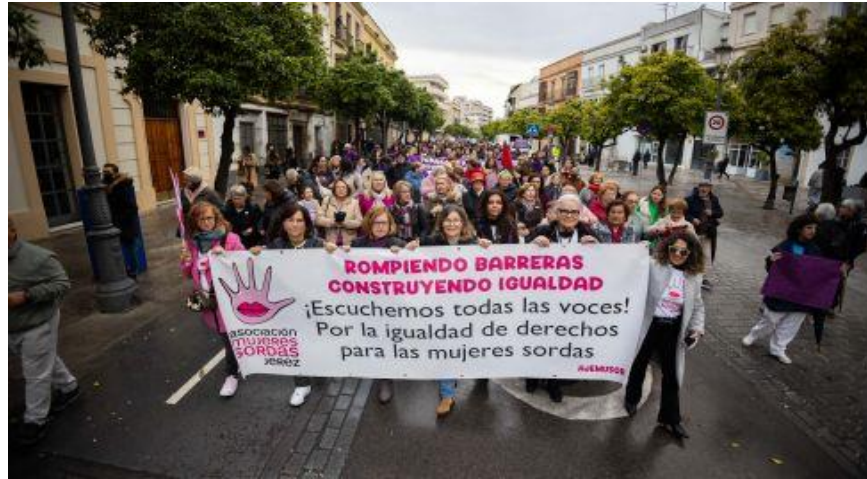
Foto: Manifestación feminista el 8 de marzo de 2024, Jerez. Portando pancarta miembros de la asociación de Mujeres Sordas.

Organiza: Marea Violeta, colabora Consejo Local de la Mujer.