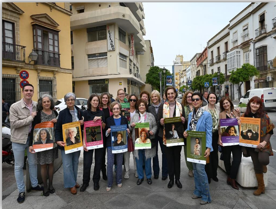
Foto: Las protagonistas de la agenda 2024 junto con las autoridades municipales y representantes del Consejo Local de la Mujer