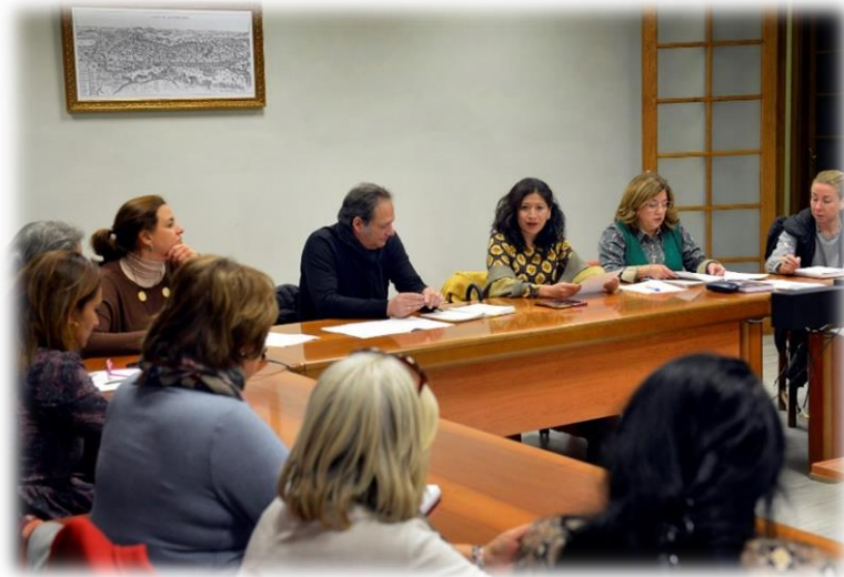
Foto: Momento de la sesión plenaria del CLM del 7 de febrero.

Día 7 de febrero, en la Sala U del propio Edificio Consistorial de Jerez.