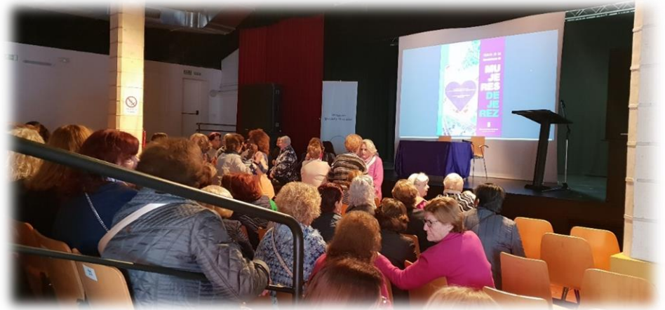
Foto: Instantánea de las mujeres asistentes.