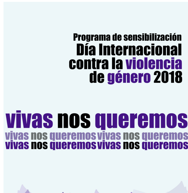
Programa Sensibilización Día Internacional contra la Violencia de Género