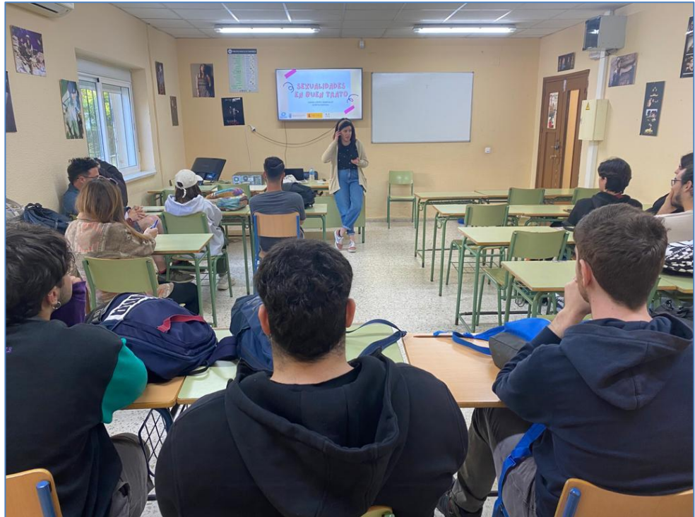
Foto Taller Sexualidades en buen trato