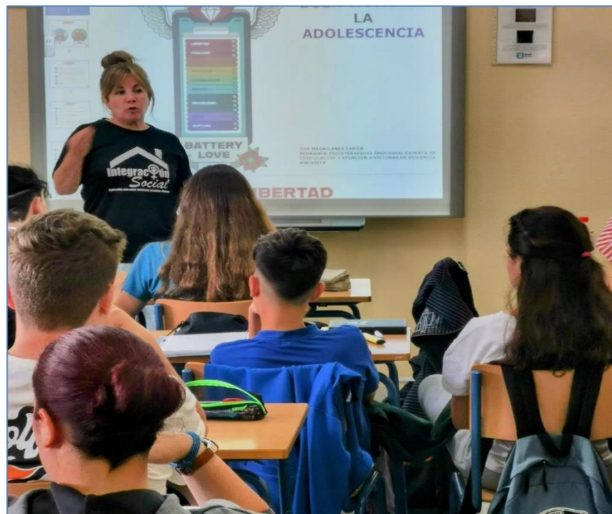
Foto Taller Relaciones en buen trato y prevención de la violencia de género