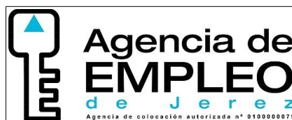
4. OFERTAS AGENCIA DE EMPLEO