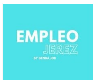
1. OFERTAS S.A.E. JEREZ