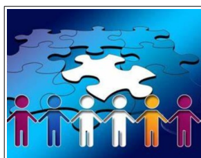
7. CONVOCATORIAS, AYUDAS, EMPLEO PÚBLICO Y BOLSAS DE EMPLEO