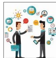
5. OFERTAS PRIVADAS DE EMPLEO