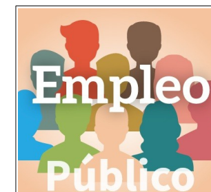
3. OFERTAS PÚBLICAS