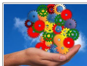
8. BOLETINES Y PORTALES DE EMPLEO EN CÁDIZ