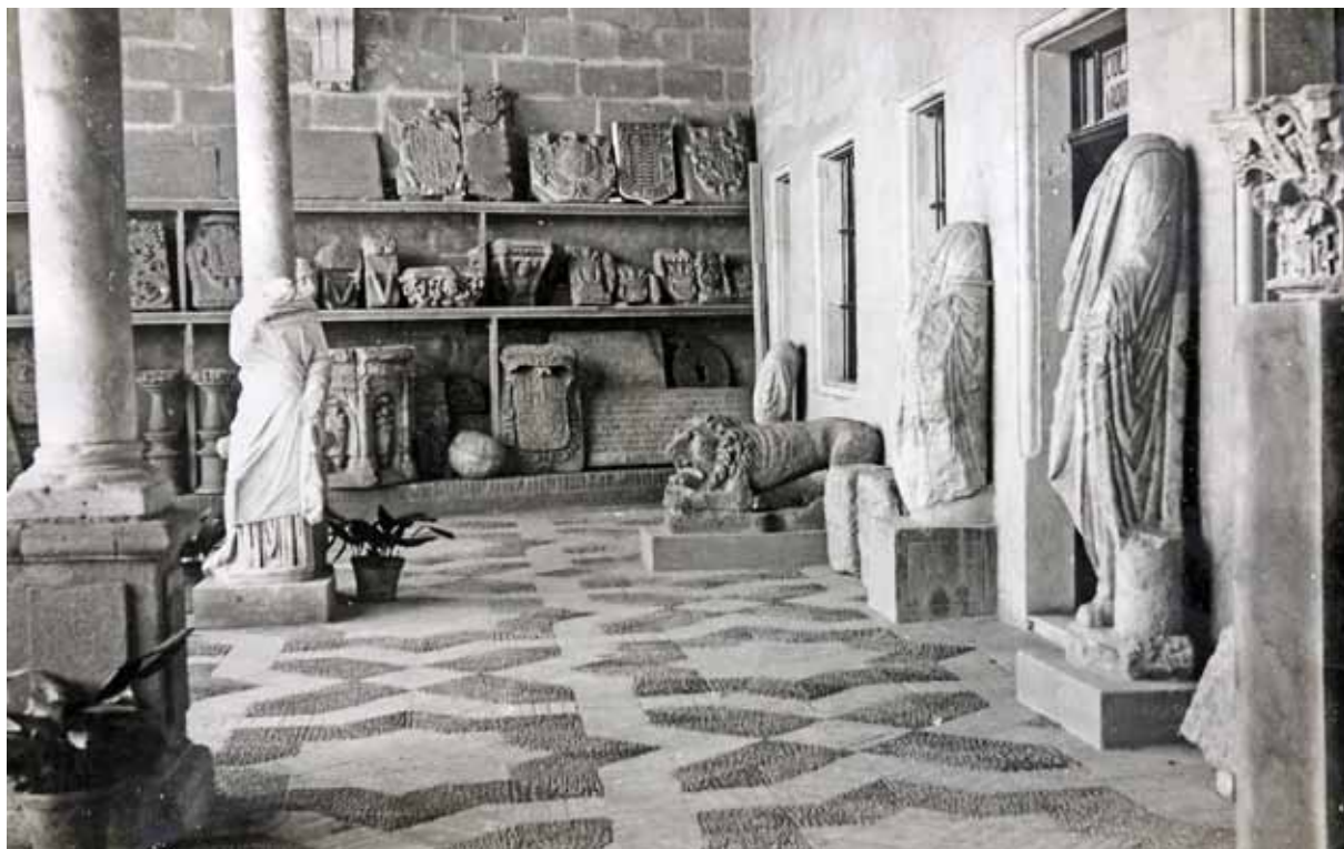
Fig. 1. Antiguas instalaciones. Colección Arqueológica Municipal. Pórtico de entrada organizado a modo de «patio arqueológico».

También en el año 1934 realiza las primeras excavaciones en el término municipal, en el enterramiento colectivo del cortijo de Alcántara, trabajos que dieron como resultado un ajuar compuesto por un numeroso conjunto de material lítico y vasijas correspondientes a la Edad de Cobre.