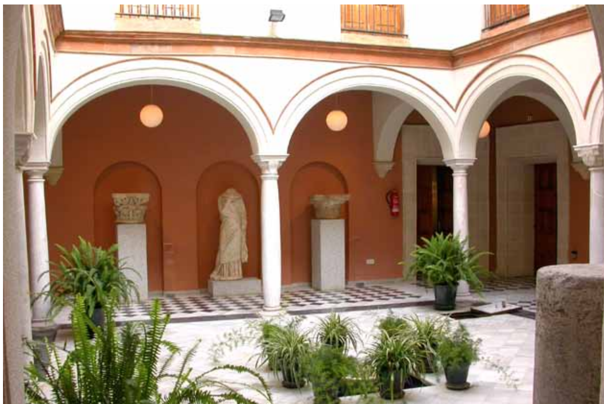
Fig. 3. Instalaciones del Museo inauguradas en 1993. Detalle del patio principal.

La llegada de los ayuntamientos democráticos supuso un nuevo giro en la historia del Museo. El 28 de septiembre de 1982 el pleno municipal aprobaba la creación de la plaza de arqueólogo y director en funciones del Museo, desvinculándolo de la biblioteca y del archivo.