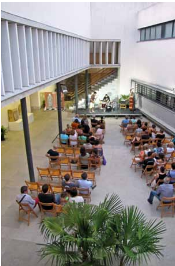
Fig. 4. Nuevo patio en zona de ampliación 2012.

en su historial el haber sido sede del primer Instituto de Enseñanza Media de la ciudad.