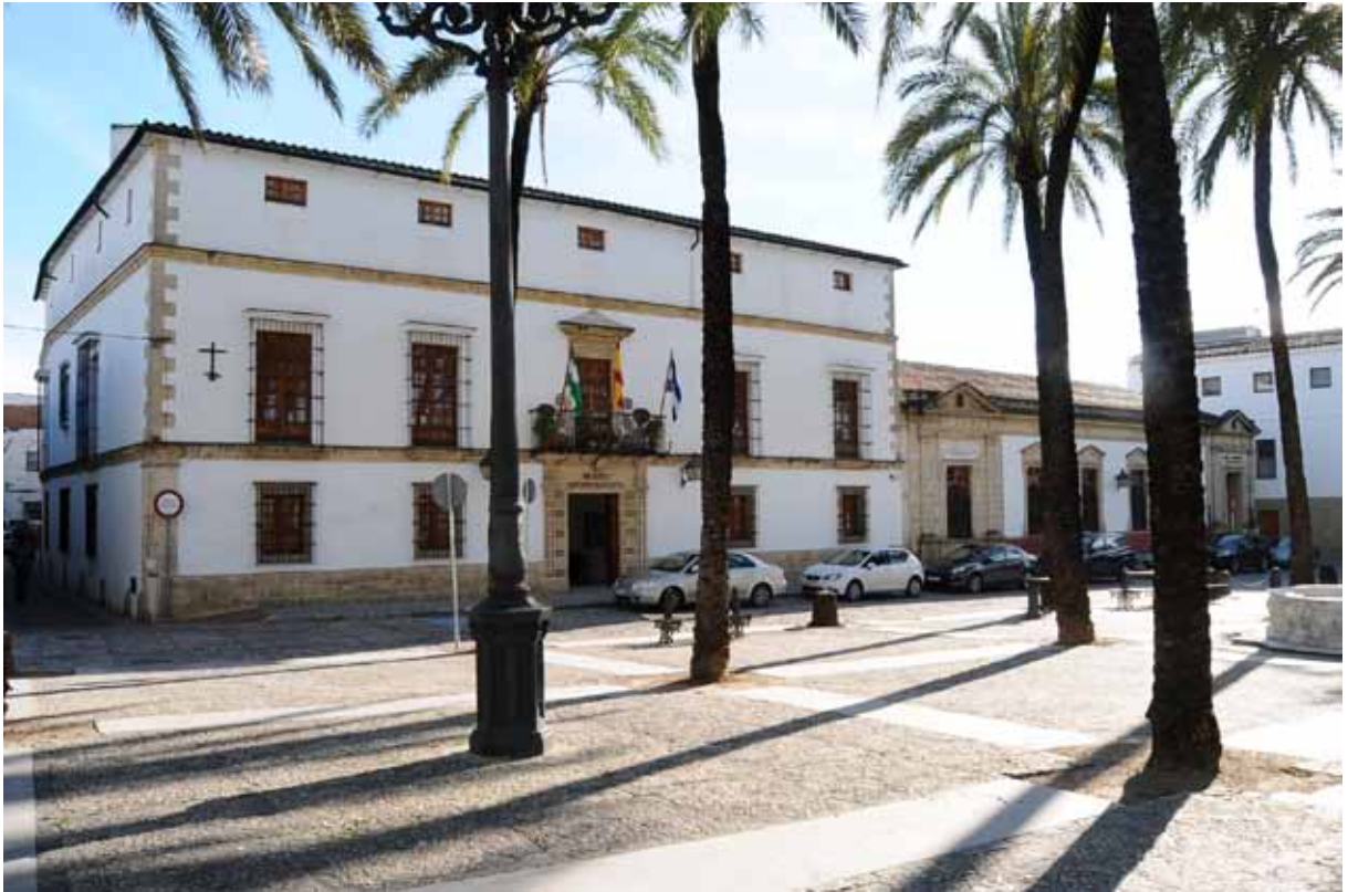
Fig. 2. Fachada principal del Museo en su nueva sede de la plaza de Mercado.

bloques de piedra con inscripción romana. Habían aparecido en Mesas de Asta en 1870, con motivo de la realización de las obras de la carretera Jerez-Trebujena, y desde entonces permanecían en una finca de su propiedad.