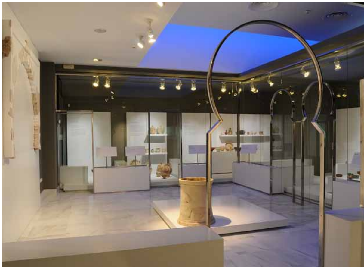
Fig. 5. Área temática «Madinat Sharish», 2012.

de espacio de depósito de fondos que el volumen de ingresos había provocado. La otra ha permitido ampliar de manera notable el área expositiva. También se ha intervenido en otras dependencias, como el laboratorio de restauración, talleres pedagógicos y parte de la zona administrativa, que han sido renovadas.