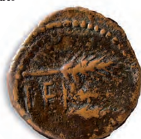
▲ Moneda de Cerret o Cerit. Hispano-romana. S. I a. C.

En la sala de numismática se expone una selección de las acuñaciones que circularon por la zona de Jerez entre el siglo III a. C. y comienzos del siglo XIX. La sección de epigrafía se dedica específicamente a los fondos de Edad Moderna. Por su parte en el patio Manuel Esteve, con cuyo nombre se rinde un sencillo homenaje al que fue primer director del museo tras su fundación formal en 1963, se disponen los elementos de una almazara del siglo XVIII procedentes de la intervención arqueológica realizada en la calle Morla.