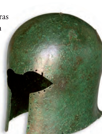
▲ Casco griego. S. VII a. C.