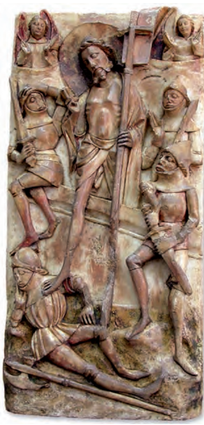
▲ Relieve inglés en alabastro. S. XV

de Granada y Valencia o el singular conjunto de vidrios hallado en la calle Manuel María González.