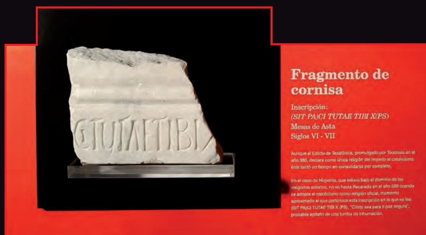
▲ Elemento destacado en recorrido rápido

Cada uno de estos elementos se encuentra destacado en el recorrido general, bien dentro de vitrina o en el exterior, con un enmarque negro sobre un fondo rojo. Un pequeño texto explicativo señala las características fundamentales de la pieza en sí y del contexto histórico al que se adscribe.