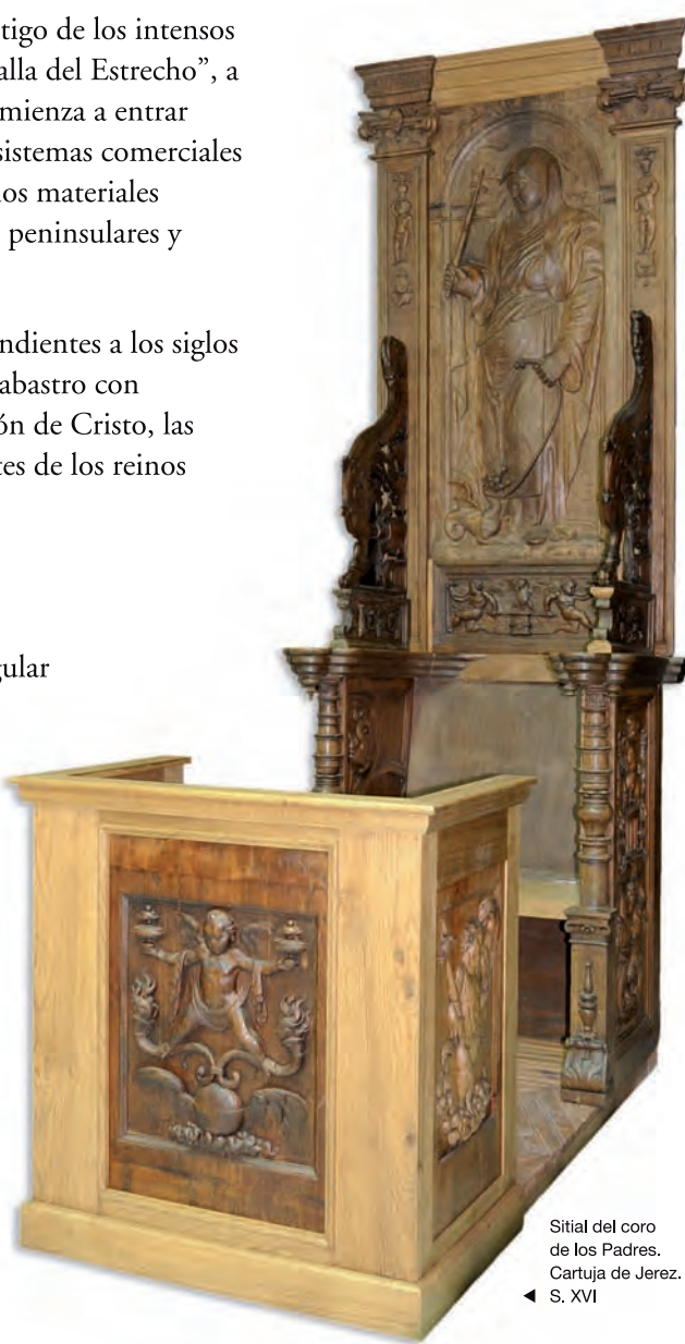
◀ Sitial del coro de los Padres Cartujos de Jerez. S. XVI

Los materiales expuestos reflejan aspectos de la vida cotidiana de cada uno de estos estamentos. Cabe reseñar el sitial de coro renacentista, donado a la ciudad por los Padres Cartujos en el momento de su marcha del monasterio.