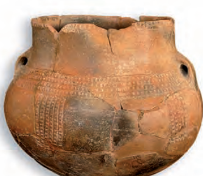
▲ Vaso cerámico. Neolítico

Las comunidades productoras en la comarca comienzan su actividad en torno al sexto milenio a. C. y se localizan en cuevas y abrigos de la zona montañosa. Destaca el vaso decorado procedente de la Sima de la Veredilla.