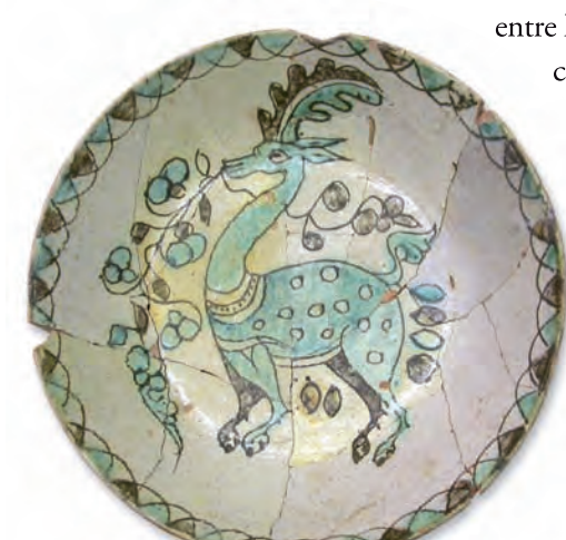
▲ Atañor con motivo de ciervo. Hispano-musulmán. S. X

entre la Antigüedad Tardía y la Edad Media, como se ilustra a través de los materiales expuestos correspondientes a los siglos VI-VII. Los broches de cinturón constituyen un buen ejemplo del arte de la orfebrería.