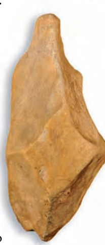
▲ Pico triédrico. Paleolítico inferior

Dedicada a los restos materiales pertenecientes a las primeras fases de ocupación humana en la zona, con una cronología que abarca entre 600.000 años y 18.000 años. Del Paleolítico inferior y medio se muestra una selección de útiles tallados procedentes de las terrazas del río Guadalete. El Paleolítico superior está representado por reproducciones de arte rupestre de la cueva de la Motilla.