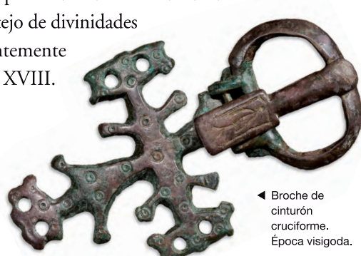
◀ Broche de cinturón cruciforme. Época visigoda.

La irrupción en la península Ibérica de los pueblos bárbaros, fundamentalmente los visigodos, no supone una ruptura con la etapa anterior sino que sirve de tránsito