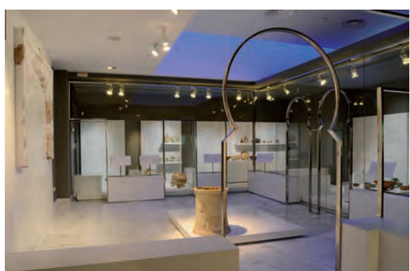
▲ Vista parcial de sala de época islámica

El paso por este corredor termina con una sección dedicada al coleccionismo, con piezas que, por diferentes motivos, tienen una historia singular que contar sobre las condiciones de su hallazgo.