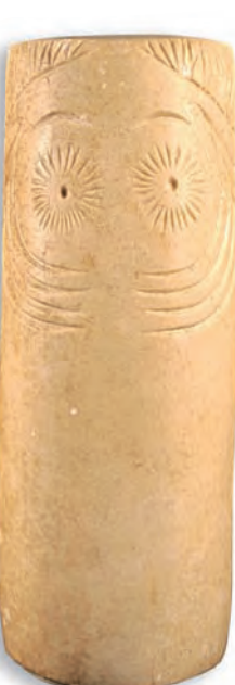
▲ Ídolo cilíndrico. III - II milenio a. C.

Los testimonios materiales de las culturas del I milenio a. C., se presentan a través de los objetos procedentes principalmente de dos yacimientos: Mesas de Asta y Cerro Naranja. Se expone también el imprescindible casco corintio del Guadalete (primer cuarto del s. VII a. C.), uno de los bronzes griegos más antiguos de la península Ibérica.